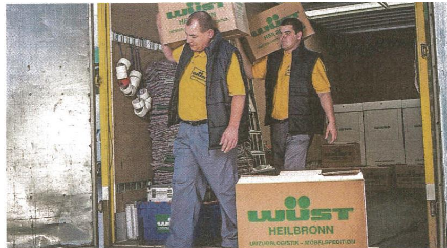
Die Heilbronner Spedition Wüst hat sich unter anderem mit Umzügen einen Namen in der Region gemacht.

Das älteste Logistikunternehmen der Region ist Wüst. Der Betrieb wurde 1868 in Heilbronn gegründet, zunächst wurden die Transporte mit Pferdegespannen und Bahnwaggons erledigt, bevor 1910 auf Kraftverkehr umgestellt wurde. Zu den klassischen Speditionsdienstleistungen kamen im Lauf der Jahre Projekte in der Stahllogistik und integrierte Logistikdienstleistungen hinzu. Heute ist Wüst mit knapp 100 Mitarbeitern in den Kernbereichen Logistik & Spedition sowie Umzug & Logistik aktiv. Der Fuhrpark des Heilbronner Unternehmens umfasst 50 Zugmaschinen mit rund 120 verschiedenen Fahrzeugeinheiten.